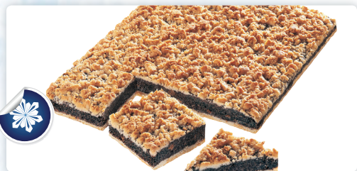
Mohn-Streusel Kuchen ungeschnitten 3500gr