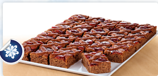
Linzer Schnitte ungeschnitten 2200gr