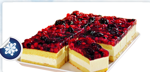
Beeren-Obers Schnitte 2000gr