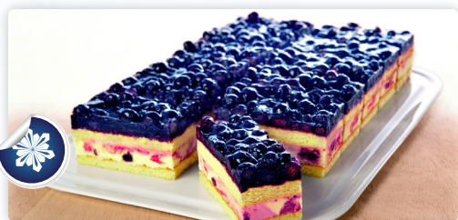
Buttermilch-Heidelbeer Schnitte 1750gr