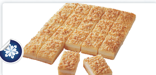
Topfen-Butterstreusel Schnitte 2600gr