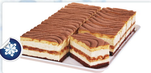
Tiramisu Schnitte 1400gr